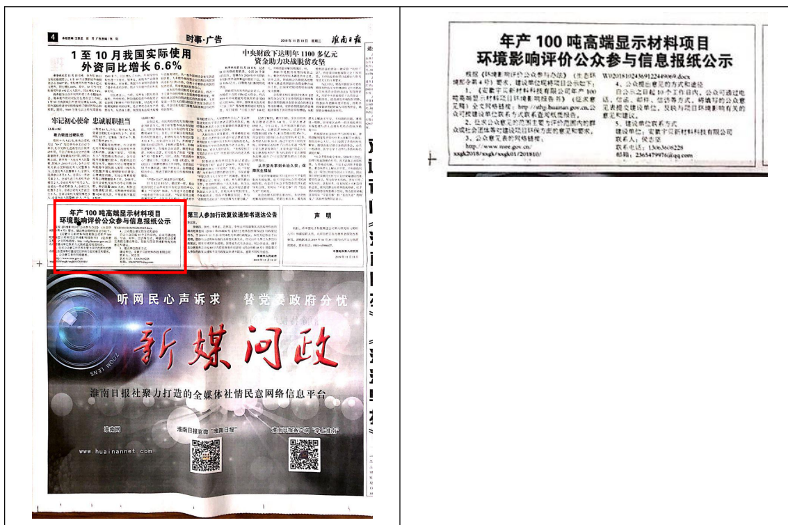
图 3.3 第二次报纸公示（2019 年 11 月 19 日）