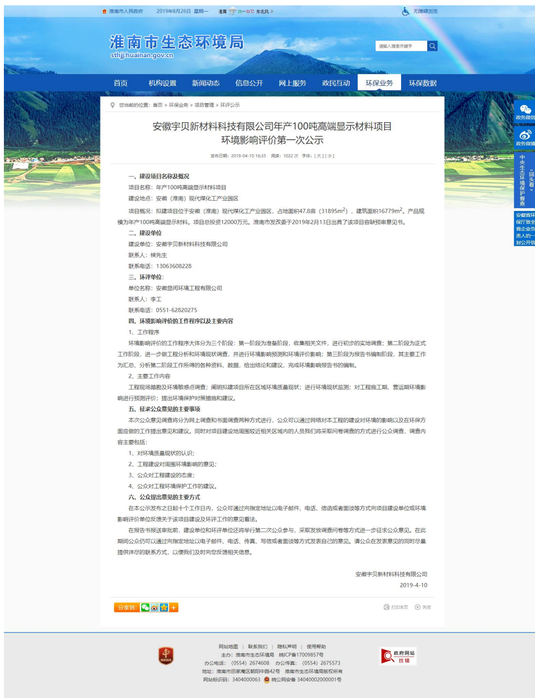
图 2.1 环境影响评价公众参与第一次公示