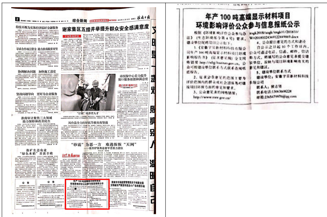
图 3.2 第一次报纸公示 (2019 年 11 月 15 日)

根据《办法》第十一条第二款要求通过建设项目所在地公众易于接触的报纸公开，本次公示报纸选择省内发行量较大的“淮南日报”是建设项目所在地公众易于接触的报纸，符合要求。报纸分两次发布，第一次发布时间为 2019 年 11 月 15 日，第二次发布时间为 2019 年 11 月 19 日。具体公示情况如图 3.2、3.3 所示。